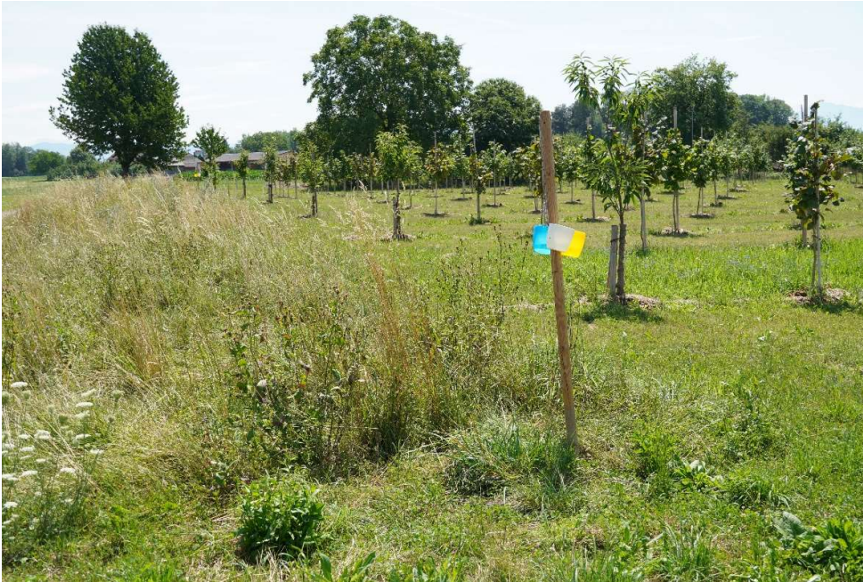
Abb. 2 Becherfallen zum Einfangen von Wildbienen auf der Haselnussplantage neben einem Saumstreifen.